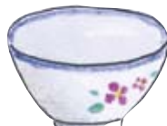
ちawan 茶碗 Cup