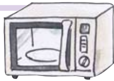
でんし れんじ 電子レンジ Microwave