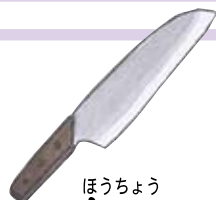
ほうちよう 包丁 Kitchen knife