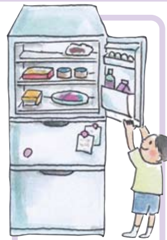
れいぞうこ 冷蔵庫 Refrigerator