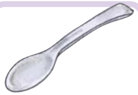
すぷーん スプーン Spoon