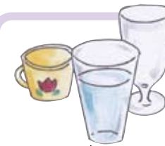
こっぷ コップ Glass