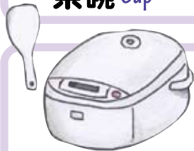
すいはんき 炊飯器 Rice cooker