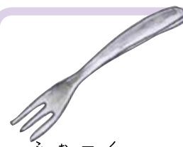
ふおーく フォーク Fork