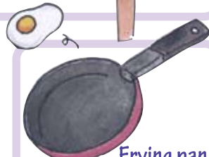
Frying pan ふらいぱん フライパン