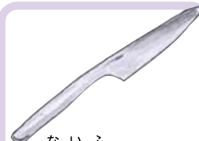
ないふ ナイフ Knife