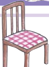
いす イス Chair