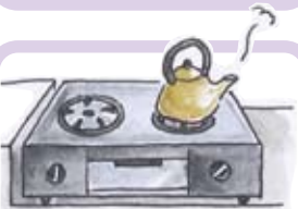
こんろ コンロ Stove