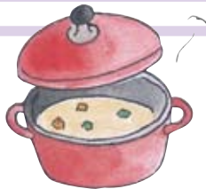
なべ 鍋 Pot