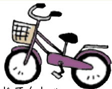
じてんしゃ 自転車 Bicycle