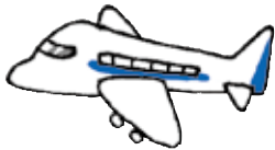
ひこうき 飛行機 Airplane