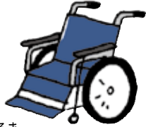
くるま 車いす Wheelchair