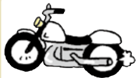
ばいく バイク Motorbike