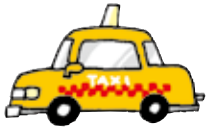
たくしー タクシー Taxi