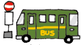
ばす バス Bus