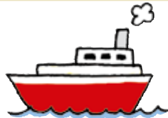
ふね 船 Ship